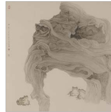
«Die Erleuchtung» 72X71cm, 2016