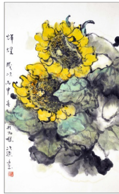
«Pracht» 67X41cm, 2016